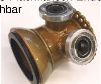
RKS Flachflansch-Ende drehbar

wird direkt durch den Einspannrahmen angepresst