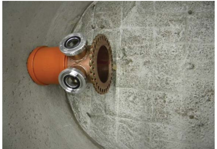
Der Druckabgangskopf Spitzende DN150 ist auf der Abflusseite zum Hauptkanal mittels KG-Doppelmuffe vormontiert.