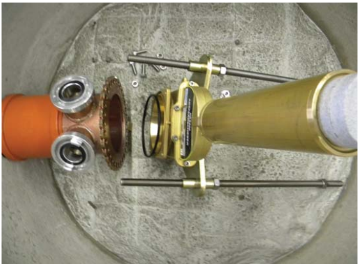
Der Absperrschieber wird mit 4 Schrauben am Druckabgangskopf befestigt, der Einspannrahmen über die Spannmuttern fixiert.