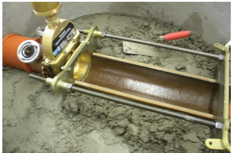
Eine Halbschale aus Steinzeug DN150 wird auf dem Untergrund betoniert, die Oberfläche glatt verstrichen.