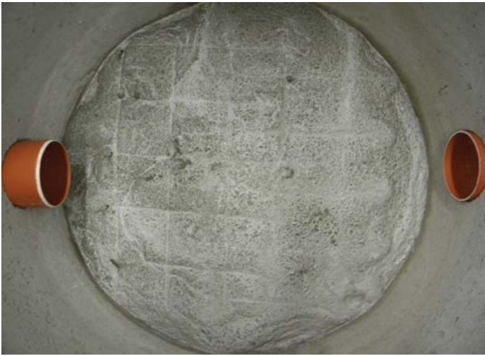
Die Schachtringe sind gesetzt, der Untergrund ist betoniert.